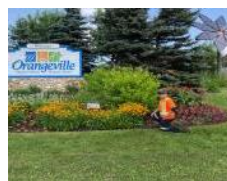
Orangeville, ON - Récipiendaire du prix pour l'Action environnementale, présenté par l'Association Canadienne des Pépiniéristes et des Paysagistes