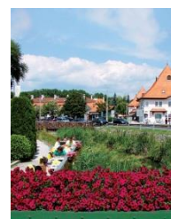
Mosonmagyaróvár, Hongrie- Récipiendaire du prix pour l'Engagement communautaire international, présenté par la Cef