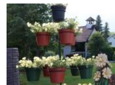
Millet, AB - Récipiendaire du prix pour la Protection du patrimoine, présenté par Cef

Gestion des arbres tient compte des efforts de la municipalité, des secteurs commerciaux et institutionnels et des résidents en matière de foresterie urbaine en ce qui concerne les politiques écrites, la réglementation et les normes de gestion (sélection, plantation, entretien); les plans de gestion à court et à long terme; les politiques de remplacement des arbres, la sélection des arbres favorisant la pollinisation, les inventaires; la lutte antiparasitaire intégrée; le patrimoine et les arbres commémoratifs.