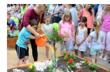
Székesfehérvár, Hongrie- Récipiendaire du prix pour l'Engagement Jeunesse International présenté par la Cef