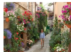
Spello, Italie - Récipiendaire du prix pour l'Aménagements floraux internationaux, présenté par Ball

- Avec l'introduction de ces niveaux, le marquage des scores sera plus critique.