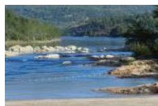
Trail, C.-B. - Récipiendaire du prix pour la Propreté, présenté par TECK

Protection du patrimoine s'applique aux efforts déployés pour conserver le patrimoine naturel et le patrimoine culturel dans une collectivité. La protection du patrimoine naturel a trait à des politiques, des plans et des actions s'appliquant à tous les éléments de la biodiversité et comprenant les écosystèmes. La protection du patrimoine culturel s'applique au patrimoine qui permet de définir la collectivité, soit l'héritage d'éléments tangibles (biens bâtis) tels que les édifices historiques, les monuments, les mémoriaux, les cimetières, les artefacts, les musées et des éléments intangibles comme les traditions, les coutumes, les festivals et les célébrations.